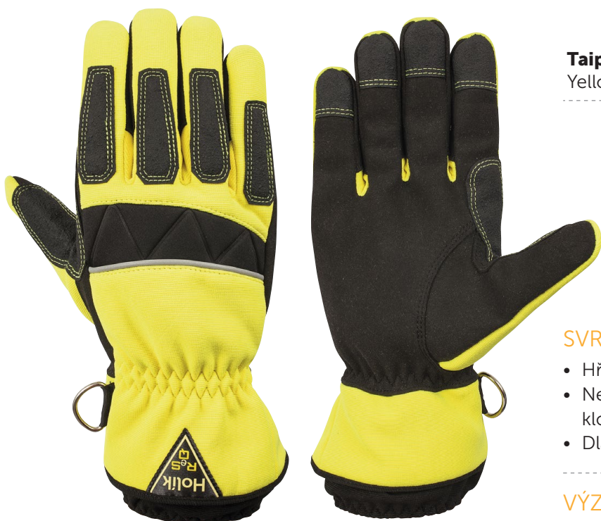
Taipa 6508 Yellow

Základní model ochranných záchranářských rukavic s vysokou ochranou dlaňové části a prstových kloubů..