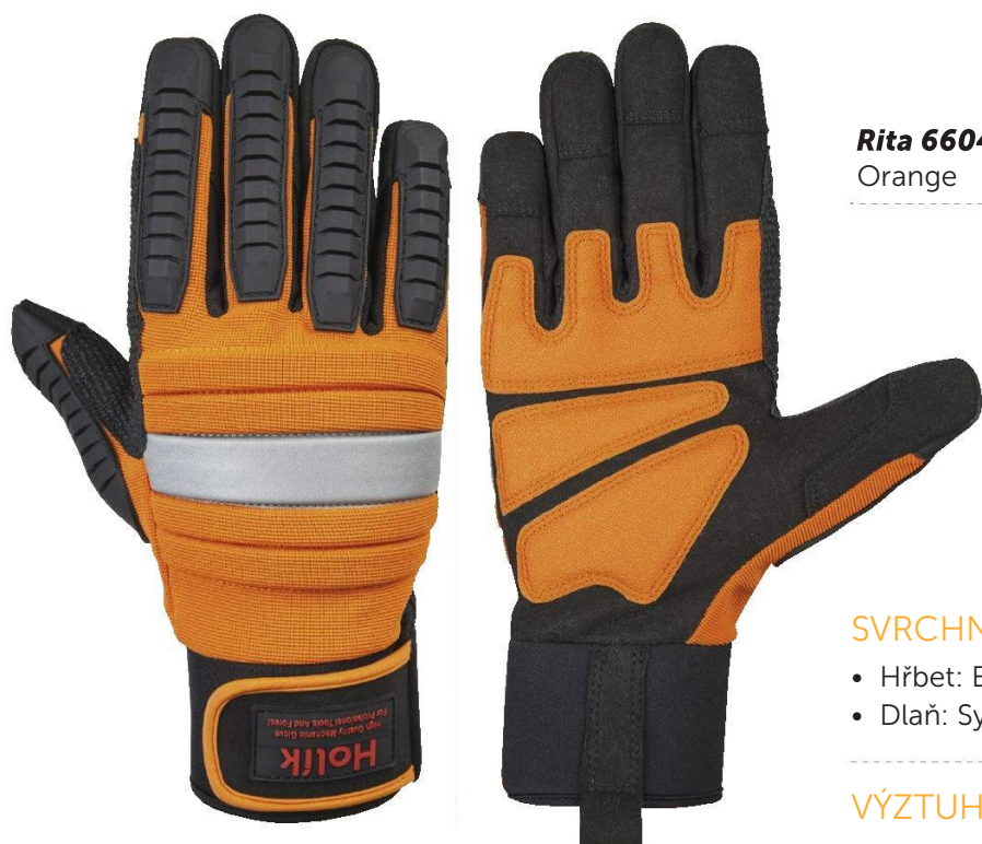
Rita 6604 Orange

Pracovní rukavice s výrazně tlumícími účinky vibrací při práci s elektrickým nářadím.