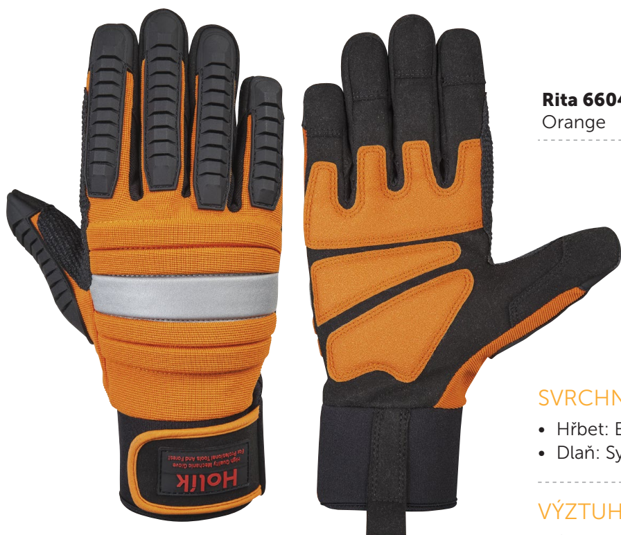
Rita 6604 Orange

Pracovní rukavice s výrazně tlumícími účinky vibrací při práci s elektrickým nářadím