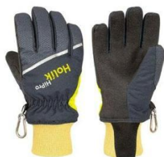
Maris Short PTFE