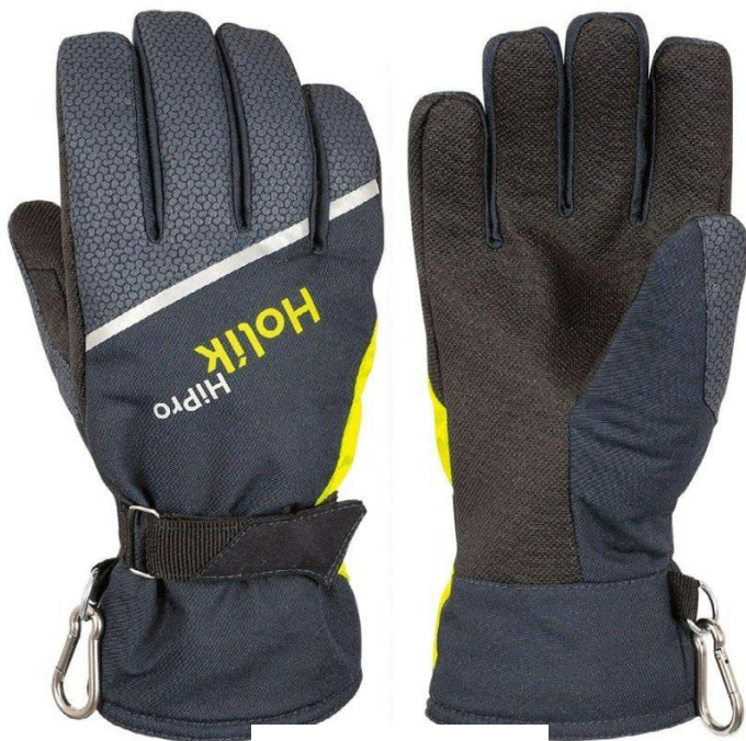
Maris Compact PTFE

Zásahová rukavice kombinující materiály Nomex®, aramidový úplet a PTFE membránu Porelle®. Naše patentovaná technologie HiPro mimořádným způsobem chrání hřbet ruky před tepelnými riziky a zároveň poskytuje celoplošnou ochranu proti úderu rukavice s membránou.