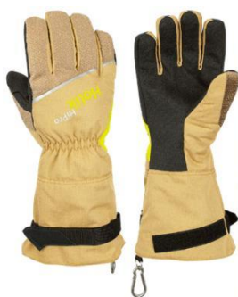
Maris Long Beige PTFE