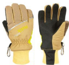
Maris Short Beige PTFE