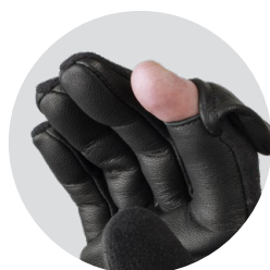
Talia Police Open