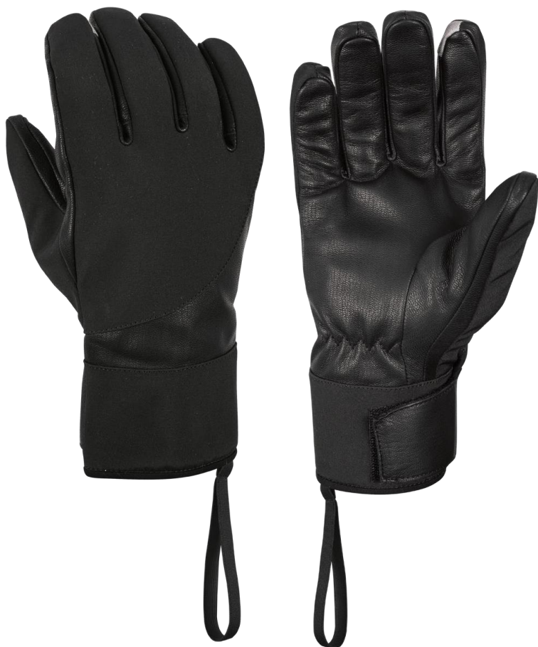
INES 8506 Black

Lehké citlivé softshellové rukavice do chladnějšího prostředí pro celodenní nošení s ochranou proti větru a vlhkosti určené pro armádní a policejní složky