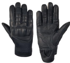
DALIE Black Quick