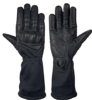
DALIE Black Long