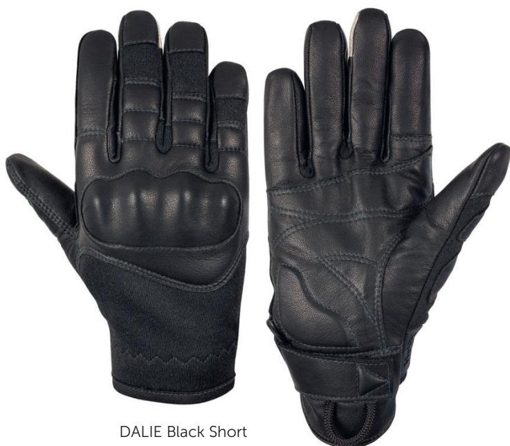
DALIE Black Short

Taktická rukavice anatomického střihu se speciálním střeleckým prstem, současně splňujícím vysoké nároky na odolnost proti mechanickým rizikům.