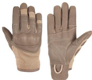
DALIE Coyote Quick