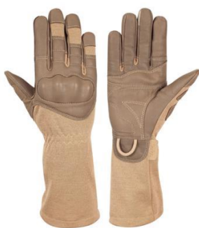
DALIE Coyote Long