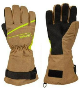
Maris Long Beige