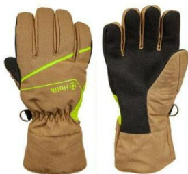
Maris Easy Beige